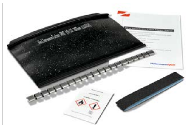
Sæt bestående af krympemanchete, lukkeskinne, rengøringsserviet, smergellærred og vejledning.