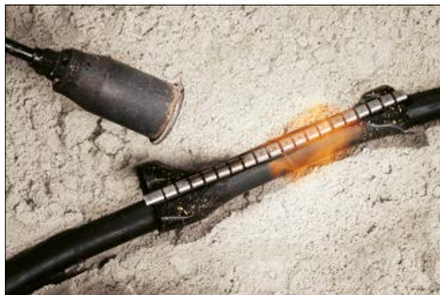
RMS manchete til kabelreparation - for sikker og hurtig reparation på stedet.