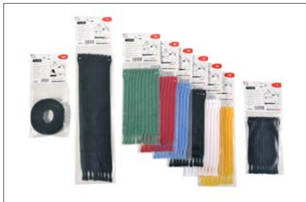
TEXTIE leveres i forskellige farver og længder.

Materiale specifikation se venligst side 26.