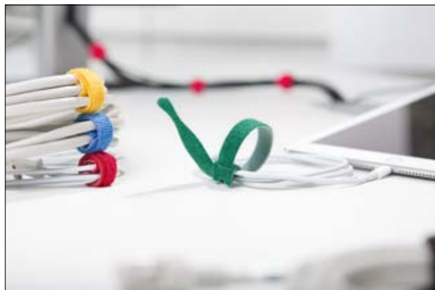
Da TEXTIE leveres i et stort udvalg af farver, er disse bånd også ideelle til farvemærkning af kabler.